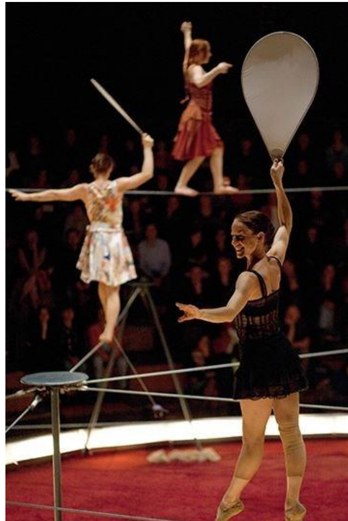
Un fil sous la neige, Les Colporteurs, Grand Chapiteau de l'Académie Fratellini, 2017